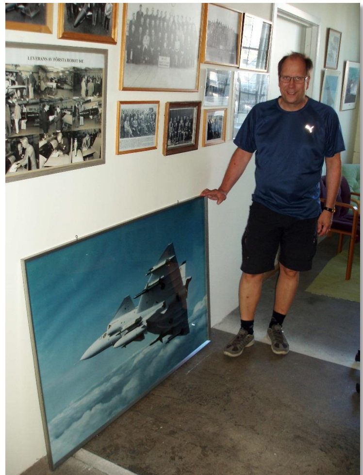
Tavla donerad av Kennet Bjursten som visar JAS planet med beväpning.