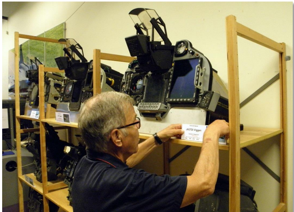
Byte till dom nya skyltarna pågår.