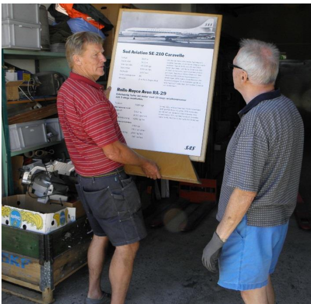
Medföljande informations tavla om Caravellen.