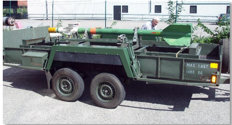
Robot 24 återlämnad efter ett lån till en utställning.