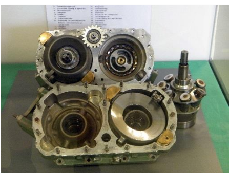
Insprutningspump delad och på plats i monter.