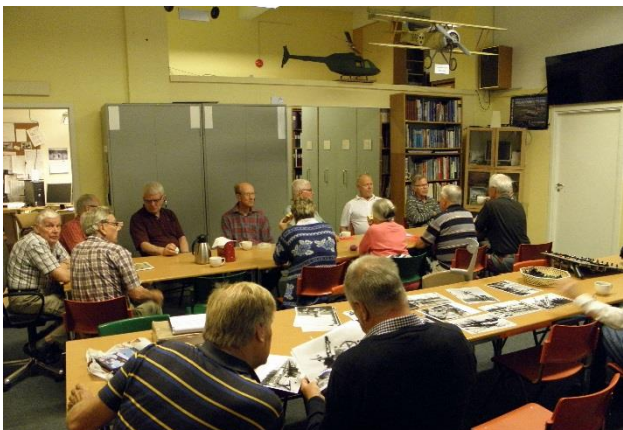
Förberedelser till filmvisning som vi har varje måndag och torsdag kl. 10.00 för medlemmar.